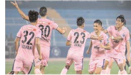
दिलाई मोहम्मदन एफसी पर जीत

कोलकाता। अनुभवी स्ट्राइकर सुनील छेत्री के ऐतिहासिक गोलों ने बेंगलुरु एफसी की नैया को डूबने से बचाते हुए मोहम्मदन एफसी पर जीत शानदार जीत दिलाई। उनके दोनों गोलों की मदद से ब्लूज ने बुधवार को एक गोल से पिछड़ने के बाद शानदार वापसी करते हुए किशोर भारती क्रीड़ांगण में खेलें गए इंडियन सुपर लीग (आईएसएल) 2024-25 मुकाबले में मेजबान ब्लैक पैथर्स पर 2-1 से जीत हासिल की। बेंगलुरु एफसी की जीत में सुनील छेत्री ने (पेनल्टी किंग) 82वें और 90+वें मिनट में गोल किए। सुनील छेत्री को ऐतिहासिक दोनों गोल करने के लिए प्लेयर ऑफ द मैच घोषित किया गया। इस हार के बाद मोहम्मदन स्पोर्टिंग का आईएसएल 2024-