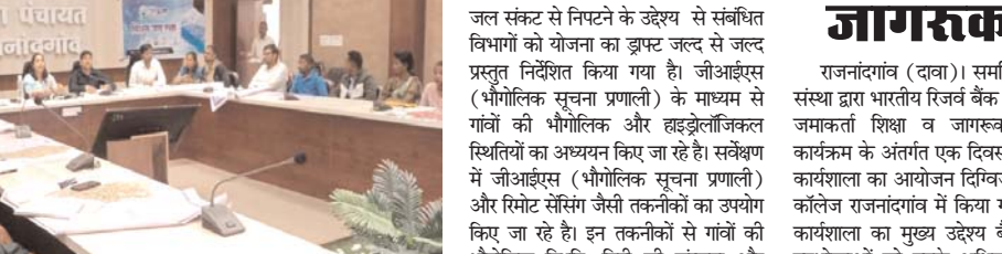
जल संकट के समाधान और ग्रामीण विकास की दिशा में एक महत्वपूर्ण कदम

राजनांदगांव (दावा)। जल, मानव जीवन का मूलभूत आधार है। इसके बिना जीवन की कल्पना असंभव है। वर्तमान समय में जल संकट एक गंभीर समस्या के रूप में उभर रहा है, विशेष रूप से ग्रामीण क्षेत्रों में। जिले के कई ग्रामीण क्षेत्र आज जलसंकट का सामना कर रहे हैं।