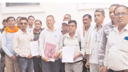
पशु चिकित्सा विभाग का कार्य होगा बाधित

डोंगरगांव (दावा)। राज्य में पशु चिकित्सा विभाग में कार्यधारित मानदेय पर कार्य करने वाले कर्मचारियों ने विभिन्न मांगों को लेकर अपना काम बंद कर दिया है जिससे पशु चिकित्सा विभाग के कार्य लगातार बाधित होगी। बता दें कि ये कर्मचारी प्राइवेट कृत्रिम गर्भाधान कार्यकर्ता, मैत्री और प्रशिक्षित गौ सेवक जो कि विभाग द्वारा प्रशिक्षण लेकर पिछले 25 वर्षों से विभाग में कृत्रिम गर्भाधान, बधियाकरण, टीकाकरण, पशु संगणना, पशु चिकित्सक शिबिर एवं विभाग की सभी गतिविधियों में काम करने वाले कार्यकर्ताओं ने मंगलवार को जनदर्शन में कलेक्टर सहित विभाग