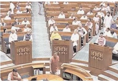
मैं तो 500 रु. का एक नोट लेकर चलता हूँ- सिंघवी

यह सीट तेलंगाना से चुने गए कांग्रेस सांसद अभिषेक मनु सिंघवी को आवंटित है। सदन स्थिति होने के बाद की जाने वाली गुरुवार एंटी-सबोटाज जांच के दौरान, सुरक्षा अधिकारियों को कैश का बंडल मिला। हालांकि, सिंघवी ने सफाई में कहा कि उन्हें घटना की कोई जानकारी नहीं है और यह रकम भी उनकी नहीं है।