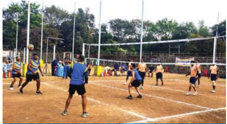
स्टेट स्कूल स्थित वॉलीबॉल मैदान में आयोजित सभी मैच होंगे रोमांचक

राजनांदगांव (दावा)। छत्तीसगढ़ स्टेट पॉवर डिस्ट्रीब्यूशन कम्पनी लिमिटेड राजनांदगांव क्षेत्र के मेजबानी में 11 दिसम्बर से 13 दिसम्बर तक अन्तर्देशीय विद्युत वॉलीबॉल प्रतियोगिता का आयोजन स्टेट स्कूल स्थित वॉलीबॉल मैदान में किया जा रहा है। प्रदेश स्तरीय इस प्रतियोगिता में विद्युत कम्पनियों के अधिकारियों एवं कर्मचारियों को क्रीड़ा के क्षेत्र में अपनी प्रतिभा, प्रतिबद्धता एवं खेलभावना को प्रदर्शित करने का अवसर प्राप्त होगा।