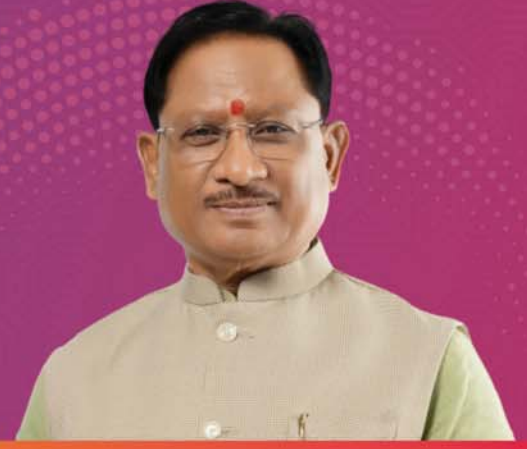
श्री विष्णु देव साय माननीय मुख्यमंत्री, छत्तीसगढ़