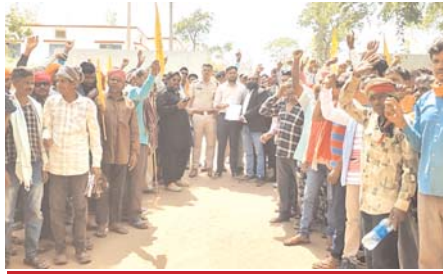
बुद्ध पूर्णिमा और श्रमिक दिवस पर दिखा पार्टी का तेवर, हाईकोर्ट के दर्जनों अधिवक्ता भी आंदोलन में शामिल

राजनांदगांव (दावा)। अंतरराष्ट्रीय श्रमिक दिवस और बुद्ध पूर्णिमा के अवसर पर फारवर्ड डेमोक्रेटिक लेबर पार्टी (एफडीएलपी) ने छत्तीसगढ़ की राजनीति में एक बड़ा धमाका किया है। अपनी मांगों को लेकर पार्टी ने 120 किलोमीटर लंबी विशाल रैली निकालकर न केवल अपनी शक्ति का प्रदर्शन किया, बल्कि शासन-प्रशासन को भी सीधे तौर पर चुनौती दी है।