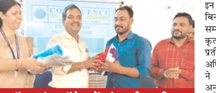
कॉम्प्लेक्स कॉलेज में अंतरराष्ट्रीय श्रमिक दिवस पर हुआ सम्मान समारोह, दैनिक उपयोगी सामग्री भेंट कर जताया आभार

राजनांदगांव (दावा)। शहर के प्रतिष्ठित कॉम्प्लेक्स कॉलेज में 1 मई को अंतरराष्ट्रीय श्रमिक दिवस के अवसर पर एक विशेष सम्मान समारोह का आयोजन किया गया। इस कार्यक्रम के माध्यम से कॉलेज प्रशासन ने संस्थान की प्रगति में महत्वपूर्ण भूमिका निभाने वाले कर्मठ श्रमिकों का अभिनंदन किया और उन्हें दैनिक उपयोगी सामग्री भेंट की।