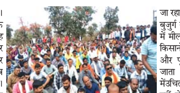
प्रशासन की वादाखिलाफी से चारभाठा क्षेत्र में आक्रोश, चक्राजाम खुलवाने दिया था आश्वासन, अब अधिकारी मौन

डोंगरगढ़/ चारभाठा (दावा)। राजनांदगांव जिले के चारभाठा क्षेत्र में बैंक शाखा खोलने का प्रशासनिक वादा पूरी तरह फेल साबित हुआ है। 2 महीने के भीतर बैंक शुरू करने का लिखित आश्वासन देकर चक्राजाम खुलवाने वाले अधिकारी अब अपनी ही डेडलाइन भूलकर मौन बैठे हैं। नतीजा यह है कि आज भी दर्जनों गांवों के हजारों किसानों को अपनी ही जमा पूंजी निकालने के लिए 20 किलोमीटर दूर का सफर तय करना पड़ रहा है। प्रशासन की इस वादाखिलाफी से क्षेत्र के ग्रामीणों में भारी आक्रोश है और उन्होंने एक बार फिर सड़कों पर उतरने की चेतावनी दी है।