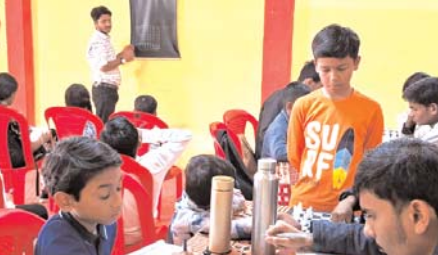
छठी और सातवीं के छात्रों ने दी वरिष्ठों को भावभीनी विदाई, नवाचारी शिक्षक के गीत से गमगीन हुआ माहौल

खैरागढ़ (दावा)। सभागीय शतरंज प्रतियोगिता का आयोजन आगामी मंगलवार 5 मई को दुर्ग सभागीय शतरंज प्रतियोगिता का आयोजन किया जा रहा है। यह प्रतियोगिता सरस्वती उच्चतर माध्यमिक शिशु मंदिर, मेन रोड, खैरागढ़ में आयोजित होगी। इस प्रतियोगिता का आयोजन के.सी.जी. जिला शतरंज संघ द्वारा जी.एच. रायसोनी स्पोर्ट्स एंड कल्चरल फाउंडेशन के सहयोग से किया जा रहा है। प्रतियोगिता में दुर्ग सभाग के अंतर्गत होने वाले जिले दुर्ग, बेमेतरा, बालोद, राजनांदगांव, मोहला-मानपुर, चौकी, कवर्धा एवं खैरागढ़-छुईखदान, गंडई के सभी आयु वर्ग के महिला एवं पुरुष खिलाड़ी भाग ले सकते हैं। प्रतियोगिता में कुल 30,000 (तीस हजार रुपये) की नगद पुरस्कार राशि