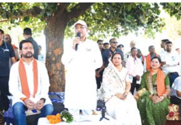
सुशासन तिहार : कटहल की छांव में ग्रामीणों से रुबरुह हुए सीएम विष्णु देव साय, क्षेत्र के लिए की करोड़ों की घोषणाएं

मुख्यमंत्री विष्णु देव साय ने कहा हमारी सरकार को महज 28 माह हुए हैं। जिसमें हमने मोदी की गारंटी के तहत अधिकांश वादे पूरे कर लिए हैं। हमने 18 लाख प्रधानमंत्री आवास, 31 सी डिजिटल में किसानों से लगातार धान की खरीदी, 2 साल का बकया बोनस, 70 लाख महिलाओं को महतारी वंदन योजना के तहत 26 किरतों के माध्यम से लगभग 1700 करोड़ रुपये प्रदान किए जा चुके हैं। कई महिलाएं इस राशि का उपयोग सिलाई बुनाई, अपने छोटे-छोटे दुकानों को बढ़ाने, सुकन्या समृद्धि योजना जैसे कार्यों में कर रही हैं। जिससे महिलाएं आर्थिक रूप से सशक्त हो रही हैं। मुख्यमंत्री ने आगे कहा कि किसान सम्मान निधि योजना के माध्यम से भी किसानों को नियमित सहायता दी जा रही है। तैदुपता संग्रहण कार्य जल्द शुरू होगा और इसकी दर 4000 रुपये से बढ़कर 5500 रुपये प्रति मानक बोरा कर दी गई है। जिससे वनांचल क्षेत्र