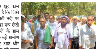
अजीब विरोधाभास : जिसे प्रशासन ने बताया डुबान क्षेत्र, वहीं धड़ले से बन रहे सरकारी आवास और सीसी रोड

खैरागढ़ (दावा)। डुबान क्षेत्र में सरकार खुद काम करवा रही है। सबसे चौकाने वाले बात यह है कि जिसे सरकार खुद डुबान क्षेत्र बना रही है। लमती नदी पर प्रस्तावित डेम परियोजना अब बड़े विवाद का रूप लेती जा रही है। खैरागढ़-छ्दखदान, गण्डई जिले के ग्राम लखना, बोरला, महुआद्वार और कटेमा के सैकड़ों ग्रामीण जिला मुख्यालय पहुंचकर सड़क पर उतर आए और कलेक्टर कार्यालय पहुंचकर अपार कलेक्टर को ज्ञापन सौंपा। ग्रामीणों ने चेतावनी दी कि यदि उनकी बात नहीं सुनी गई तो आंदोलन और तेज होगा इस पूरे मामले में सबसे चौकाने वाली बात यह है कि जिस जमीन को डेम के डुबान क्षेत्र में बताया जा रहा है। उसी जगह पर सरकार खुद विकास कार्य करा रही है। पंचायत के जरिए सीसी रोड का निर्माण जारी है। वहीं प्रधानमंत्री आवास योजना के तहत 8 से 10 मकान बन रहे हैं। ग्रामीणों का कहना है कि लमती नदी उनके लिए सिर्फ जल स्रोत नहीं बल्कि जीवन की धुरी है। यही यस्ता खेती रोजगार और दैनिक आवागमन का आधार है। प्रस्तावित डेम बनने की स्थिति में लखनाटोला समेत कई बस्तियां पूरी तरह डुबान में आ जाएंगी। इसका सीधा असर हजारों लोगों की आजीविका, बच्चों की शिक्षा और सामाजिक ढांचे पर पड़ेगा। बड़े डेम बनाए जा रहे हैं जो ग्रामवासियों की रूठ भूमि डुबान क्षेत्र में आ जाने के कारण अपनी पुस्तैनी एवं खानदानी भूमि से