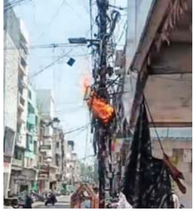
है कि आसपास की दुकानों व रहवासी घरों सहित लोगों की गाड़ियां व आसपास में खेलने वाले बच्चे इसकी चपेट में नहीं आए वरना एक बड़ी जन-धन की हानि हो सकती थी।

राजनांदगांव (दावा)। अभी पड़ रही भीषण गर्मी के कहर से अब आदमी के साथ-साथ विद्युत ट्रांसफार्मर के भी छूटने लगे हैं। शहर के भारतमता चौक के जैन ज्वेलर्स समीप स्थित बिजली के ट्रांसफार्मर ने दोपहर के समय भीषण गर्मी के चलते अपना आधा खो दिया और चिंगारी फेंकने लगा। इससे डर कर लोग जान बचाने के लिए इधर-उधर भागने लगे। प्रत्यक्षदर्शियों ने बताया कि भीषण गर्मी व बिजली के पावर की ओवर लोड होने की वजह से रावण दहन की तरह खंबे से चिनगारियों की फुलझड़ियां छूटने लगीं और आग लग गई। इससे खंबे की पूरी वायरिंग जल कर खाक हो गई। इस घटना से आसपास लगे सीसीटीवी कैमरे भी इसके चपेट में आ गए। गनीमत