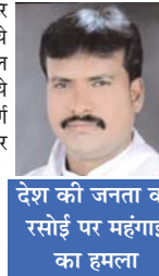
देश की जनता की रसोई पर महंगाई का हमला

फीस, बिजली-पानी के बिल और रोजमर्रा की आवश्यक वस्तुओं की महंगाई से जुड़ रहा परिवार अब रसोई गैस के इस नए झटके से और अधिक परेशान होगा। स्पष्ट है कि भाजपा सरकार की नीतियाँ आम नागरिक की रसोई और रोजगार दोनों पर भारी पड़ रही हैं। सरकार को बताना चाहिए कि अखिर कब तक मध्यम वर्ग और गरीब परिवारों को इस तरह महंगाई का बोझ ढोना पड़ेगा? पेट्रोल-डीजल और एलपीजी सिलेंडर के दामों में मममानी बढ़ोतरी हुई है। कौन कसता है कि मोदी सरकार विकास नहीं कर रही... वे विकास कर रही है वो भी महंगाई में विकास बेरोजगारी में विकास भ्रष्टाचार में विकास, घोटालों में विकास और देश भर में बढ़ते अपराध जातिवाद में विकास। भाजपा सरकार रहत देने नहीं, बल्कि आम लोगों की मेहनत की कमाई लूटने का काम कर रही है। अब जनता सब देख रही है।