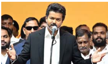
दो घड़े में बंटी एआईएडीएमके

चेन्नई। तमिलनाडु में थलापति विजय सरकार ने विश्वासमत जीत लिया है। विजय के पक्ष में पड़े 144 वोट। इससे पहले 59 सदस्यीय डीएमके ने विश्वासमत का बहिष्कार किया था। गौरतलब है कि तमिलनाडु की 234 सदस्यीय विधानसभा में बहुमत का आंकड़ा 118 का है। टीवीके ने 108 सीटों पर जीत हासिल की है। डीएमके को 59 सीटों पर जीत मिली है। एआईएडीएमके ने 47 सीटों पर जीत हासिल की है। कांग्रेस को 5 सीटें मिली हैं। पीएमके को चार सीटों पर विजय मिली थी। ऐसे में डीएमके के बहिष्कार के बाद सदन में बहुमत का आंकड़ा और कम हो गया था। ऐसे में विजय का फ्लोर टेस्ट अब महज औपचारिकता रह गई थी। भाजपा रही न्यूट्रल फ्लोर टेस्ट के दौरान डीएमके ने न केवल बहिष्कार किया बल्कि वोटिंग से भी दूर रही। बीजेपी का सदन में केवल एक विधायक है और वो इस प्रक्रिया के दौरान 'तटस्थ' की भूमिका में रहे। इससे पहले विधानसभा की कार्यवाही शुरू होने के बाद सीएम विजय ने सदन में विश्वासमत पेश किया था।