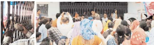
○ पट्टा दिलाने की मांग को लेकर प्रशासनिक व्यवस्था का विरोध कर रहे थे ○ जानकारी मिलते ही दल-बल के साथ मौके पर पहुंची पुलिस ○ मामला - शहर के वार्ड नंबर 5 इंदिरा नगर का

डोंगरगढ़ (दावा)। शहर के वार्ड नंबर 05, इंदिरा नगर स्थित डॉ. आंबेडकर भवन में आयोजित सुशासन तिहार के दौरान वार्डवासियों ने जमीन का पट्टा दिलाने के नाम से शिविर में पहुंचे अधिकारियों को बंधक बनाने का मामला प्रकाश में आया है। वार्ड वासी विगत अनेक वर्षों से पट्टा देने की मांग कर रहे हैं। शिविर में आधासन नहीं मिलने पर स्थानीय निवासियों ने कार्यक्रम का विरोध शुरू कर दिया। आक्रोशित वार्डवासियों ने भवन में ताला जड़कर प्रशासन के खिलाफ जमकर नारेबाजी की। स्थानीय लोगों का आरोप है कि लंबे समय से पट्टा नहीं मिलने के कारण वे प्रधानमंत्री आवास योजना सहित कई शासकीय योजनाओं के लाभ से वंचित हैं। कई बार आवेदन और मांग के बावजूद समस्या का समाधान नहीं होने से लोगों में भारी नाराजगी है। बताया जा रहा है कि करीब डेढ़ घंटे तक आंबेडकर भवन में ताला लगा रहा। जिससे कार्यक्रम पूरी तरह प्रभावित हो गया। स्थिति बिगड़ते देख मौके पर बड़ी संख्या में