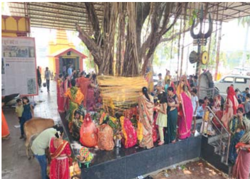
ताप और समर्पण की सुनी कथा, बांटा गया शरबत

सुईखदान (दावा)। वट सावित्री व्रत के पावन अवसर पर सुईखदान नगर पूरी तरह से धार्मिक आस्था और श्रद्धा के रंग में रंगा नजर आया। नगर के डीपरा पारा स्थित पुराना धाना परिसर के प्राचीन वट वृक्ष और बड़े तालाब के पास स्थित बरगद पेड़ के नीचे सुबह से ही सुहागिन महिलाओं का हजूम उमड़ पड़ा। महिलाओं ने पूरे विधि-विधान और अटूट श्रद्धाभाव के साथ वट का पालन करते हुए पति की लंबी आयु, परिवार की सुख-समृद्धि एवं अखंड सौभाग्य की कामना की। सुबह से ही महिलाएं पूजा की धाली, फल-फूल, धूप-दीप, कलश एवं अन्य आवश्यक सामग्री लेकर वट वृक्षों के पास पहुंचने लगी थीं। देवते ही देवते पूजा स्थलों पर भारी भीड़ जुट गई और पूरा वातावरण भक्तिमय हो उठा।