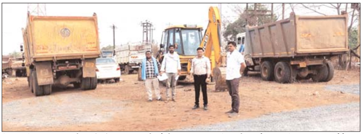
विरुद्ध नियमानुसार कड़ी कार्रवाई लगातार जारी रहेगी। कलेक्टर ने संबंधित अधिकारियों को अवैध गतिविधियों पर सतत निगरानी रखने तथा शिकायत प्राप्त होने पर तत्काल कार्रवाई सुनिश्चित करने के निर्देश दिए हैं।