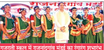
गुजराती स्कूल में राजनांदगांव मंडई का रंगारंग शुभारंभ (संचालक Ever Grow Health) को बधाई दी गई। उनके प्रयासों से यह आयोजन क्षेत्रीय व्यापारियों, कलाकारों और उद्यमियों के लिए एक सशक्त मंच बन पाया है। मंडई में प्रतिदिन सांस्कृतिक प्रस्तुतियों के साथ-साथ विभिन्न प्रतियोगिताएँ आयोजित होंगी। जिनमें स्थानीय प्रतिभाओं को अपनी कला और कौशल प्रदर्शित करने का अवसर मिलेगा। साथ ही झुले और मनोरंजन की सुविधाएँ बच्चों और परिवारों के लिए आकर्षण का केंद्र रहेंगी।