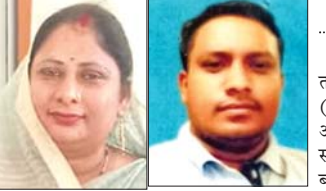
जित का दावा, चुनावी बिसात बिछी

राजनांदगांव (दावा)। नगरीय निकाय आम-चुनाव 2026 के मद्देनजर भारतीय जनता पार्टी के बाद अब छत्तीसगढ़ प्रदेश कांग्रेस कमेटी ने भी धुमका नगर पंचायत के लिए अपने अधिकृत प्रत्याशियों की घोषणा कर दी है।