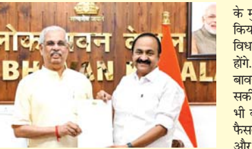
मंत्रिमंडल को लेकर चर्चा शुरूवार को शुरू हुई और कांग्रेस नेताओं और गठबंधन सहयोगियों के बीच कई दौर की बैठकों के बाद राविवार शाम को लिस्ट फाइनल हुई।

तिरुवनंतपुरम। केरलम में विधानसभा चुनाव के नतीजे आने के दो हफ्ते बाद यूडीएफ की सरकार का गठन होने जा रहा है। केरलम में सोमवार को नई सरकार का शपथ ग्रहण होगा। इस सरकार में कांग्रेस के वीडि सतीशन मुख्यमंत्री पद की शपथ लेंगे। उनकी सरकार में उन्हें मिलाकर 21 मंत्री होंगे। सतीशन ने राविवार को लोक भवन पहुंचकर गवर्नर राजेंद्र विधनाथ आलेंकर को कैबिनेट की लिस्ट सौंपी। वीडि सतीशन की सरकार में रमेश चेन्नियला भी कैबिनेट मंत्री बनेंगे। चेन्नियला भी मुख्यमंत्री पद की रस में थे। हालांकि, हर्षकमान ने सतीशन को चुना। कांग्रेस ने 14 मई को सतीशन को विधायक दल का नेता चुना था। केरलम के विधानसभा चुनाव में कांग्रेस की अगुवाई वाले DF ने 140 में से 102 सीटें जीती थीं। लेकिन 10 दिन तक मुख्यमंत्री को लेकर फैसला नहीं कर पाई थी। मुख्यमंत्री की रस में सतीशन के अलावा केसी चेण्णुपाल और चेन्नियला भी थे।