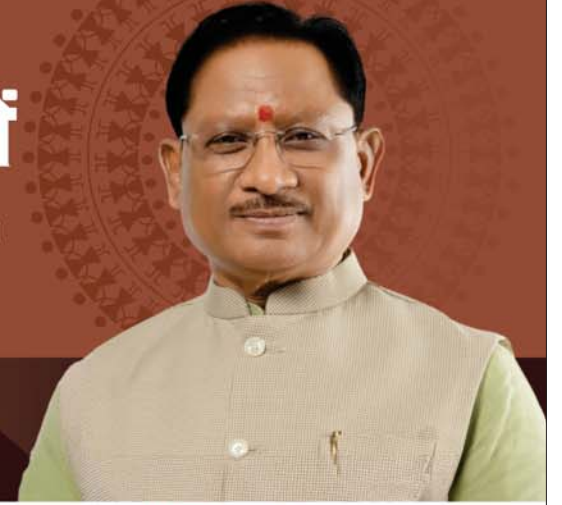
श्री विष्णु देव साय माननीय मुख्यमंत्री, छत्तीसगढ़