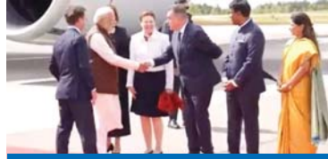
बंगाली तरीके से उतारी गई आरती, फाइटर जेट्स ने एस्कॉर्ट किया

एम्स्टर्डम। प्रधानमंत्री नरेन्द्र मोदी 8 साल बाद स्वीडन पहुंचे हैं। इससे पहले उन्होंने 2018 में स्वीडन का दौरा किया था। पीएम मोदी का विमान जैसे ही स्वीडन की सीमा में पहुंचा, स्वीडिश फाइटर जेट्स ने उसे सुरक्षा देते हुए एस्कॉर्ट किया। इसका वीडियो भी सामने आया है। स्वीडन के प्रधानमंत्री उल्फ क्रिस्टरसन पीएम मोदी को रिसीव करने गोथेनबर्ग एयरपोर्ट पर पहुंचे। होटल पहुंचने पर मोदी की बंगाली तरीके से आरती उतारी गई। स्वीडन दौरे के दौरान पीएम मोदी भारतीय समुदाय के लोगों से भी मुलाकात कर सकते हैं। यह दौरा भारत और स्वीडन के बीच संबंधों को और मजबूत करने के लिए है। स्वीडन ने पीएम मोदी को अपने अत्यंत प्रतिष्ठित और ऐतिहासिक सम्मान रॉयल ऑर्डर ऑफ द पोलर स्टार से सम्मानित किया। स्वीडन की राजकुमारी विक्टोरिया ने पीएम मोदी को यह सम्मान सौंपा।