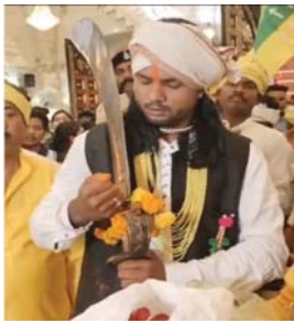
और सनातन पूजा के मध्य विवाद का कारण बनी।