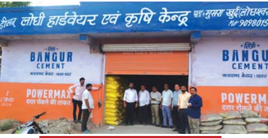
मुसराखुर्द स्थित मेसर्स लोधी कृषि केन्द्र एवं मोहारा स्थित मेसर्स महादेव कृषि केन्द्र में दी गई दबिश