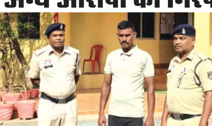
आरोपियों के कब्जे से 4 नग गौ वंश, कार व बाइक बरामद

मिली जानकारी के अनुसार गौ रक्षक व सेवक ने दिनांक 14 मई को रात्रि करीब 12 बजे देखा कि एक व्यक्ति रोड में बैठे घुमंतु मवेशी को ग्राम अमलीडीह भाटपारा तालव के पास इकट्ठा कर रहा है और संदेह हुआ कि वे मवेशी तस्करी कर रहे हैं। उन्होंने तत्परता दिखाते हुए 112 को फोन कर मवेशी तस्करी के संबंध में सूचना दी। उसी दौरान एक सिल्वर रंग कि महिन्द्रा एक्सयूव्ही 500 कार क्रमांक एमएच