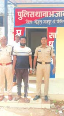
एससी/एसटी एक्ट के तहत सख्त कार्रवाई, आरोपी न्यायिक रिमांड पर भेजा गया

जांच उपरांत अपराध पंजीबद्ध कर विवेचना हेतु आज्ञाक धाना को डायरी सुपुर्द की गई, जिसमें यह तथ्य प्रकाश में आया कि