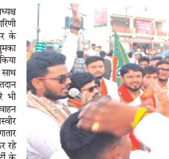
नवीन घुमका नगर पंचायत के चुनाव में आज युवा मोर्चा ने पैदल मार्च के माध्यम से अपनी हुंकार भरी

वॉर की स्थिति के कारण दुनिया के सभी देशों में महंगाई चरम सीमा पर है और युद्ध के आगज के कारण पेट्रोल डीजल एवं गैस की उपलब्धता प्रभावित हो रही है, इसकी चिंता करने के लिए मोदी जी ने पांच देशों की यात्राएँ की और राजनीति के समीक्षक उनकी इस यात्रा की भूरि भूरि प्रशंसा कर रहे हैं कि संकट के घड़ी में भी देश का मुखिया मूलभूत संसाधनों के लिए लगातार प्रयासरत है, परंतु दीपक बैज और