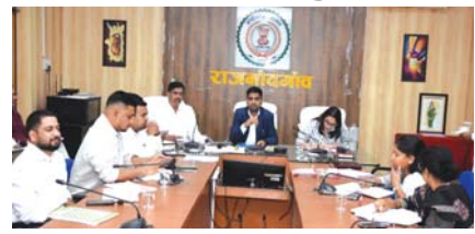
कलेक्टर ने साप्ताहिक समय-सीमा की ली बैठक

कलेक्टर ने कलेक्टोरेट सभाकक्ष में आयोजित बैठक में विभिन्न विभागों की प्रगति की समीक्षा करते हुए योजनाओं के प्रभावी क्रियान्वयन एवं लंबित कार्यों को निर्धारित समय-सीमा में पूर्ण करने के निर्देश दिए। कलेक्टर ने सुशासन तिहार 2026 अंतर्गत शिविरों में प्राप्त आवेदनों का गुणवत्तापूर्ण एवं समयबद्ध निराकरण सुनिश्चित किया जाए। कलेक्टर ने शिविर में प्राप्त आवेदनों का गंभीरता से परीक्षण कर मौके पर ही गुणवत्ता जांच कर पात्र हितग्राहियों को त्वरित लाभ उपलब्ध कराने के निर्देश दिए। कलेक्टर ने तेज गर्मी एवं बढ़ते तापमान को ध्यान में रखते हुए विद्युत विभाग के अधिकारियों को जिले के सभी विद्युत सब स्टेशनों एवं ट्रांसफार्मरों में अग्नि सुरक्षा के पुख्ता इंतजाम सुनिश्चित