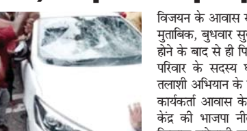
मुताबिक ईडी अधिकारियों ने पूर्व मुख्यमंत्री पिनाराई विजयन के आवास पर छपा पूरा कर लिया था और जब वे वहां से निकल रहे थे, तो पार्टी कार्यकर्ताओं ने उनके वाहनों को रोक दिया। भीड़ को तितर-बितर करने के लिए पुलिस ने लाठीचार्ज किया। आरोप है कि काफिला निकलने से पहले सीपीआई (एम) के कार्यकर्ताओं ने ईडी के तीन वाहनों को नुकसान पहुंचाया और उन पर पत्थर फेंके। इस बीच जैसे-तैसे ईडी के अधिकारी केरल के पूर्व मुख्यमंत्री और सीपीआई (एम) नेता पिनाराई

तिरुवनंतपुरम। तिरुवनंतपुरम में पूर्व मुख्यमंत्री और मौजूदा नेता प्रतिपक्ष पिनाराई विजयन के आवास के बाहर सीएसपी (एम) कार्यकर्ताओं ने ईडी अधिकारियों की गाड़ी पर हमला कर दिया। ये कार्यकर्ता केंद्रीय एजेंसी के खिलाफ विरोध प्रदर्शन कर रहे थे। कोचीन मिनरल्स एंड रूटइल लिमिटेड (सीएमआरएल) मामले में केरल के 10 ठिकानों पर एजेंसी द्वारा तलाशी अभियान चलाया गया था। तिरुवनंतपुरम में भीड़ को नियंत्रित करने के दौरान एक पुलिसकर्मी घायल हो गया है।