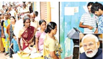
एफसीआई के गोदाम से लेकर अंतिम राशन दुकान और लाभार्थी तक हर चरण की निगरानी एकीकृत तरीके से हो सकेगी। इससे पता लगाना आसान होगा कि किस राज्य में कितना अनाज पहुंचा है। किस दुकान पर कितना वितरण हुआ और कहां गड़बड़ी की आशंका है। अभी राशन व्यवस्था दो अलग-अलग योजनाओं के जरिए चल रही है। पहली योजना में भारतीय खाद्य निगम (एफसीआई) के गोदामों से अनाज उतारकर राज्यों को जिलों, ब्लॉकों और राशन दुकानों तक पहुंचाने के लिए आर्थिक मदद दी जाती है। इसी में उचित मूल्य दुकानदारों का कमीशन भी शामिल है। दूसरी योजना में स्मार्ट पीडीएस के जरिए राशन व्यवस्था को डिजिटल और तकनीक आधारित बनाया जा रहा है।

नई दिल्ली। देश के 81.35 करोड़ गरीबों तक समय पर और पूरी मात्रा में राशन पहुंचाने के लिए केंद्र सरकार सार्वजनिक वितरण प्रणाली (पीडीएस) में बड़ा बदलाव करने जा रही है। प्रधानमंत्री नरेंद्र मोदी की अध्यक्षता में बुधवार को आर्थिक मामलों की मंत्रिमंडलीय समिति ने नई 'सार्थक-पीडीएस' योजना को मंजूरी दी है। इसपर पांच वर्षों में 25,530 करोड़ रुपये खर्च किए जाएंगे। सरकार का दावा है कि नई व्यवस्था से राशन वितरण अधिक पारदर्शी, तेज और भरोसेमंद बनेगा तथा गरीबों तक सही मात्रा में अनाज पहुंच सकेगा। माना जा रहा है कि यदि राज्यों में इसे सही तरीके से लागू किया गया तो राशन व्यवस्था में पारदर्शिता बढ़ेगी।