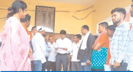
आरोपी के विरुद्ध कार्रवाई एवं अपनी सुरक्षा को लेकर लामबंद हुए सरपंच संघ के साथीगण, एसडीएम को दिया गया ज्ञापन