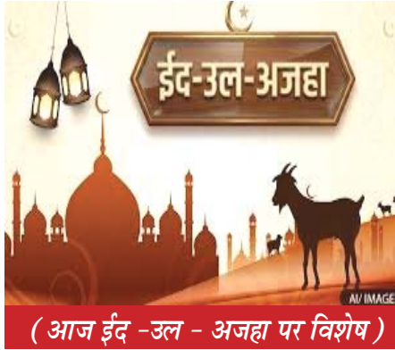
(आज ईद -उल - अजहा पर विशेष)

ईद-उल-फितर के बाद ईदजुहा या ईद-उल-अजहा जिसे ईद-ए-अजहा, ईद-ए कुर्बा या बकरीद का पर्व भी कहते हैं, सारे विश्व में पारंपरिक रूप से मनाया जाता है, ईदजुहा एक के साथ जुड़ा हुआ मुसलमानों का प्रमुख पर्व है।