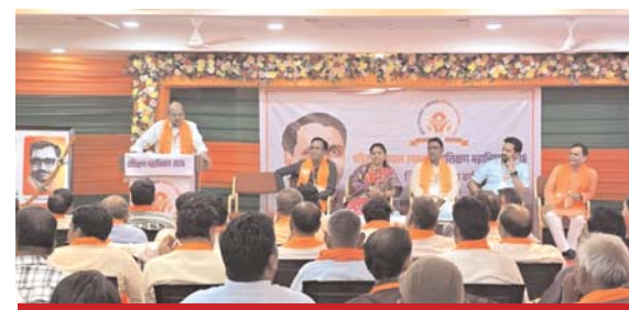
कार्यकर्ताओं के बल पर चलती है भाजपा -सांसद रूप कुमारी चौधरी