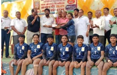
आल इंडिया कबड्डी प्रतियोगिताओं में श्रेष्ठ प्रदर्शन कर शहर को किया गौरवान्वित