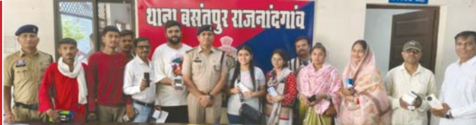
थाना बसंतपुर राजनांदगांव

अपना खोया फोन और जरूरी दस्तावेज वापस पाकर भावुक हुए मोबाइल स्वामी, पुलिस का जताया आभार