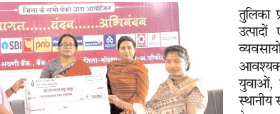
एक माह में बैंकों ने स्वीकृत किए लगभग 49 करोड़ रुपये के ऋण, स्वरोजगार और उद्यमिता को मिला बढ़ावा