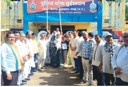
भाजपा नेताओं पर मानहानि और माहौल बिगाड़ने का आरोप कड़ी कार्रवाई की मांग नगर पंचायत अध्यक्ष व जनप्रतिनिधियों के सम्मान पर आघात का आरोप दोषियों पर कड़ी कार्रवाई की मांग

बैनर लेकर किए गए आक्रामक प्रदर्शन से नगर में भय और तनाव का वातावरण निर्मित हुआ जिससे सामाजिक सौहार्द एवं शांति व्यवस्था प्रभावित होने की आशंका बनी। उन्होंने कहा कि इस प्रकार की गतिविधियां नगर की कानून व्यवस्था के लिए चुनौती बन सकती है। थाना प्रभारी को सौंपे गए जापान में कांग्रेस नेताओं और पाषंडों ने मांग की है कि पूरे मामले की निष्पक्ष जांच कर संबंधित भाजपा पदाधिकारियों एवं कार्यकर्ताओं के विरुद्ध मानहानि शांति भंग करने सार्वजनिक रूप से