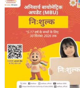
माता-पिता के बायोमेट्रिक के आधार पर बनाया जाता है। बच्चा जब 5 वर्ष की आयु पूर्ण कर लेता है, तब उसका बायोमेट्रिक अद्यतन कराना अनिवार्य होता है। इसी प्रकार 15 से 17 वर्ष की आयु के दौरान भी बायोमेट्रिक अपडेट आवश्यक है। समय के साथ व्यक्ति की आंखों, उंगलियों के निशान एवं चेहरे की बनावट में परिवर्तन