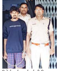
रिपोर्ट दर्ज कराई गई थी कि गत 5 अप्रैल को उसकी होंडा शाइन मोटरसाइकिल (क्रमांक सीजी 08 बीबी 0294) ग्राम बनभेड़ी के पास से किसी अज्ञात चोर द्वारा पार कर दी गई थी। प्रार्थी की शिकायत पर थाना लालबाग में अपराध क्रमांक 138/2026 धारा 303(2) बीएनएस के तहत मामला पंजीबद्ध कर विवेचना में लिया गया था।