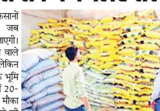
अनावश्यक भंडारण पर रोक लगेगी तथा पूरे सीजन में किसानों को खाद की उपलब्धता सुनिश्चित की जा सकेगी।

रायपुर (दावा)। छत्तीसगढ़ में किसानों के लिए यह पहला अवसर होगा, जब किसानों को खाद भी किशतों में दी जाएगी। खास बात ये है कि सबसे कम खर्च वाले छोटे किसानों को पूरी खाद मिलेगी, लेकिन बड़े एकड़ और पांच एकड़ से अधिक भूमि वाले किसानों को दो से तीन किशतों में 20-20 दिनों के बाद खाद लेने का मौका मिलेगा। हालांकि अभी भी रायपुर जिले की कई सोसाइटियों में डीएपी खाद्य नहीं है। वहां अर्जेंट बताते हुए कहा कि याचिका में की गई पहली मांग पर यह जोर देना चाह रहे हैं वो महत्वपूर्ण है। वकील ने कहा कि उनकी मांग है कि नीट यूजी की 21 जून को दोबारा होने वाली परीक्षा पेन-पेपर के बजाए कंप्यूटर बेस्ड मोड से कराई जाए। लेकिन कोर्ट ने अंतरिम (शेष पृष्ठ 6 पर...)