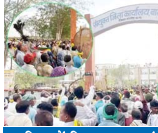
आदिवासी समाज के लोग कलेक्टरों के घेराव करने पहुंचे।

ग्रामीणों का कहना है कि, पाटेधर धाम गांव की जमीन पर बना है। गांव के विकास कार्यों को पाटेधर धाम में करवाया जाता है। आदिवासी समाज के पाट (पहाड़) जिसमें समाज के देवता हैं, उसे भी कब्जे में कर लिया गया है। इसलिए सर्व आदिवासी समाज जमाड़ी पाटेधर धाम और बाबा बालक दास पर कार्यवाही की मांग कर रहा है।