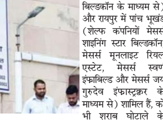
प्रवर्तन निदेशालय, रायपुर में छत्तीसगढ़ शराब घोटाले के संबंध में जांच के लिए एक बैठक का दृश्य।