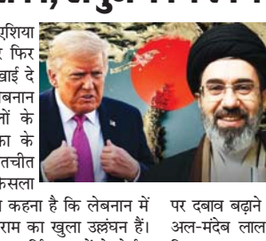
होर्मुज जलमार्ग पर भी दी चेतावनी

ईरान के इस फैसले के बाद अमेरिका और इस्त्राएल पर अंतरराष्ट्रीय दबाव बढ़ सकता है। गाजा और लेबनान में जारी सैन्य कार्रवाई को लेकर पहले से कई देशों में चिंता जताई जा रही है। अब ईरान ने साफ कर दिया है कि जब तक उसकी शर्तें नहीं मानी जाएंगी, तब तक बातचीत आगे नहीं बढ़ेगी। इससे क्षेत्र में शांति प्रयासों को बड़ा झटका लग सकता है।