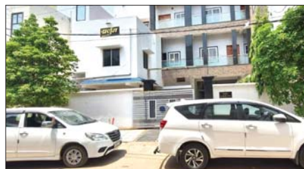
सीबीआई की जांच में हुआ था कथित धांधली का खुलासा

शिक्षक कॉलोनी स्थित निवास को सुरक्षा घेरे में लेकर कागजात खंगाल रहे अधिकारी, सीबीआई के बाद अब प्रवर्तन निदेशालय ने कसौ कमान