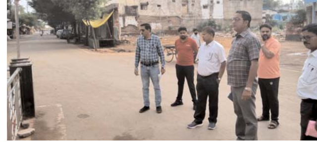
सफाई में और सुधार लाने, कूड़ा-कचरा तत्काल उठाने तथा बाजार क्षेत्रों की स्वच्छता पर विशेष ध्यान देने के निर्देश दिए।

सेन्टर परिसर में जमा कबाड़ सामग्री को तत्काल संबंधितों को बेचने के निर्देश दिए ताकि वहां जगह साफ रहे