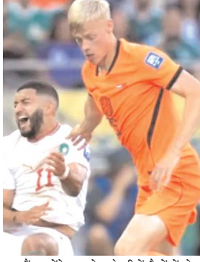
एक हैं। उन्होंने ग्रुप स्टेज के तीनों मैचों में गोल किए और राउंड ऑफ 32 में नीदरलैंड के खिलाफ निर्णायक शूटआउट में पेनल्टी को गोल में बदला। उनकी अनुपस्थिति के कारण मोरक्को को 2022 वर्ल्ड कप की उपविजेता