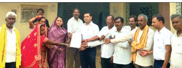
13 जुलाई को अंतिम फैसला नहीं तो सपरिवार विधान कार्यालय के सामने आत्मघाती कदम उठाने को मजबूर होंगे पीड़ित किसान

डोंगरगांव (दावा)। छत्तीसगढ़ में कमजोर वर्ग के किसानों को भूमि अधिग्रहण और सुदूरवर्षों के चंगुल से बचाने के लिए बने ऋण मुक्ति अधिनियम 1976 की डोंगरगांव अनुविभागीय अधिकारी (एसडीएम) न्यायालय में धरिज्या उड़ती दिखाई दे रही है। न्याय की आस में पिछले 16 वर्षों से भटक रहे पीड़ित किसानों का धैर्य अब पूरी तरह जवाब दे चुका है। पिछले 2 साल 9 महीनों में 96 पेशियां (सुनवाई) न्याय के बाद भी जब किसानों को भुगतान नहीं मिला, तो अब उन्होंने आंदोलन की अंतिम चेतावनी दे दी है।