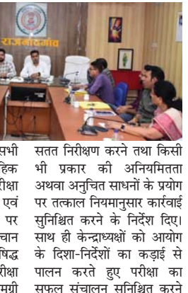
पारदर्शिता बनाए रखना सभी अधिकारियों की सामूहिक जिम्मेदारी है। उन्होंने परीक्षा सामग्री के सुरक्षित संधारण एवं वितरण, परीक्षा केन्द्रों पर अभ्यर्थियों के प्रवेश, पहचान सत्यापन, बैटक व्यवस्था, निष्पक्ष सामग्री पर नियंत्रण तथा परीक्षा समाप्ति के उपरांत गोपनीय सामग्री के सुरक्षित संकलन एवं प्रेषण संबंधी सभी प्रक्रियाओं की विस्तार से जानकारी दी।

राजनांदगांव (दावा)। छत्तीसगढ़ लोक सेवा आयोग द्वारा आयोजित सूबेदार, उप निरीक्षक स्वर्ग एवं प्लाटून कमांडर (प्रारंभिक) परीक्षा-2024 का आयोजन 12 जुलाई को प्रातः 10 बजे से दोपहर 12 बजे तक जिले के 7 परीक्षा केन्द्रों में किया जाएगा। परीक्षा के सफल, निष्पक्ष एवं शांतिपूर्ण संचालन के लिए आज कलेक्टर टैट सभाकक्ष में परीक्षा से संबंधित सभी केन्द्राध्यक्षों, प्रेक्षकों (ऑब्जर्वर) एवं प्लाटाईंग स्क्रॉड टीम (एफएएसटी) का प्रशिक्षण आयोजित किया गया।