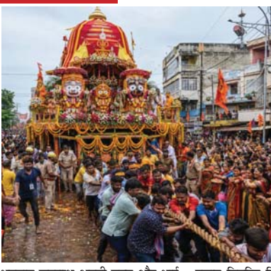
भगवान जगन्नाथ अपनी बहन और भाई प्रसाद वितरित किया जाएगा। एकादशी के दिन भगवान पुनः अपने रथ पर सवार होकर बाजे-गाजे के साथ अपने मूल मंदिर (गांधी चौक) लौटेंगे। जिसके साथ ही रथयात्रा उत्सव संपन्न होगा। श्री जगन्नाथ रथयात्रा आयोजन समिति ने नगर के सभी धर्मप्रेमी नागरिकों, माताओं और बहनों से आग्रह किया है कि वे इस भव्य रथयात्रा में सम्मिलित होकर प्रभु का रथ खींचें और

राजनांदगांव (दावा)। आषाढ़ शुक्ल द्वितीया के पावन अवसर पर 16 जुलाई (गुरुवार) को संस्कारधानी नगरी में भगवान जगन्नाथ महाप्रभु की भव्य रथयात्रा पूरी श्रद्धा, भक्ति और धूमधाम के साथ निकाली जाएगी। ओष्ठिका के श्री जगन्नाथपुरी की तर्ज पर स्थानीय स्तर पर भी नगर भ्रमण की यह परंपरा सदियों से चली आ रही है। राजनांदगांव के गांधी चौक स्थित प्राचीन श्री जगन्नाथ मंदिर से रथयात्रा निकाले जाने का यह 87वां वर्ष है। जिसे लेकर भक्तों में भारी उत्साह है। पारंपरिक रथ को भव्य रूप देने के लिए अनेक सेवादर दिन-रात तैयारियों में जुटे हुए हैं। गांधी चौक से शुरू होकर रथयात्रा नगर भ्रमण करते हुए जूनी हटरी स्थित श्री राम-जानकी मंदिर पहुंचेगी। जहां पारंपरिक सनातन संस्कृति के अनुसार भगवान का भव्य स्वागत किया जाएगा।